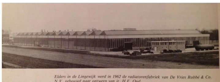
Elders in de Lingewijk werd in 1962 de radiatorenfabriek van De Vries Robbé & Co. N.V. gebouwd naar ontwerp van ir. H.E. Oud.

Ooit waren het florerende bedrijven waar veel dorpingen emplooi vonden. Inmiddels lang vervlogen, maar de verhalen blijven. Over opgaan, blinken en verzinken. Laat u meenemen in de verhalen en misschien heeft u zelf ook een inbreng.